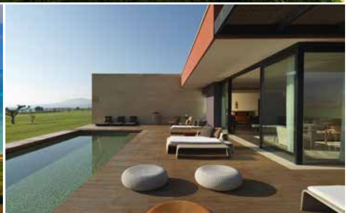
Das Verdura Golf & Spa Resort, das an der sizilianischen Südküste hat sich vom Start weg mit an die Spitze europäischer Golf & Spa Resorts kataultiert.